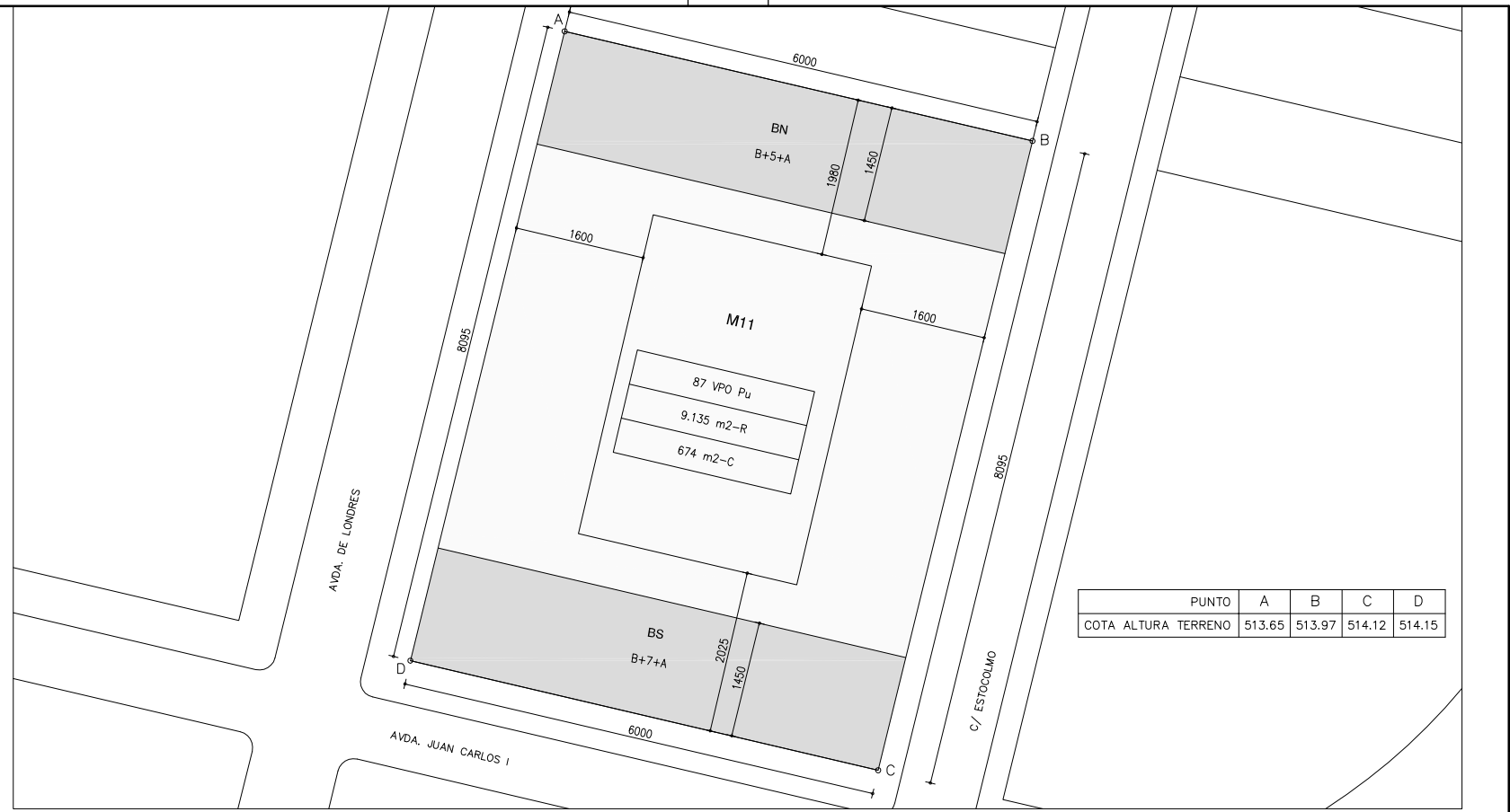
PLANTA EMPLAZAMIENTO COTAS E. 1/500