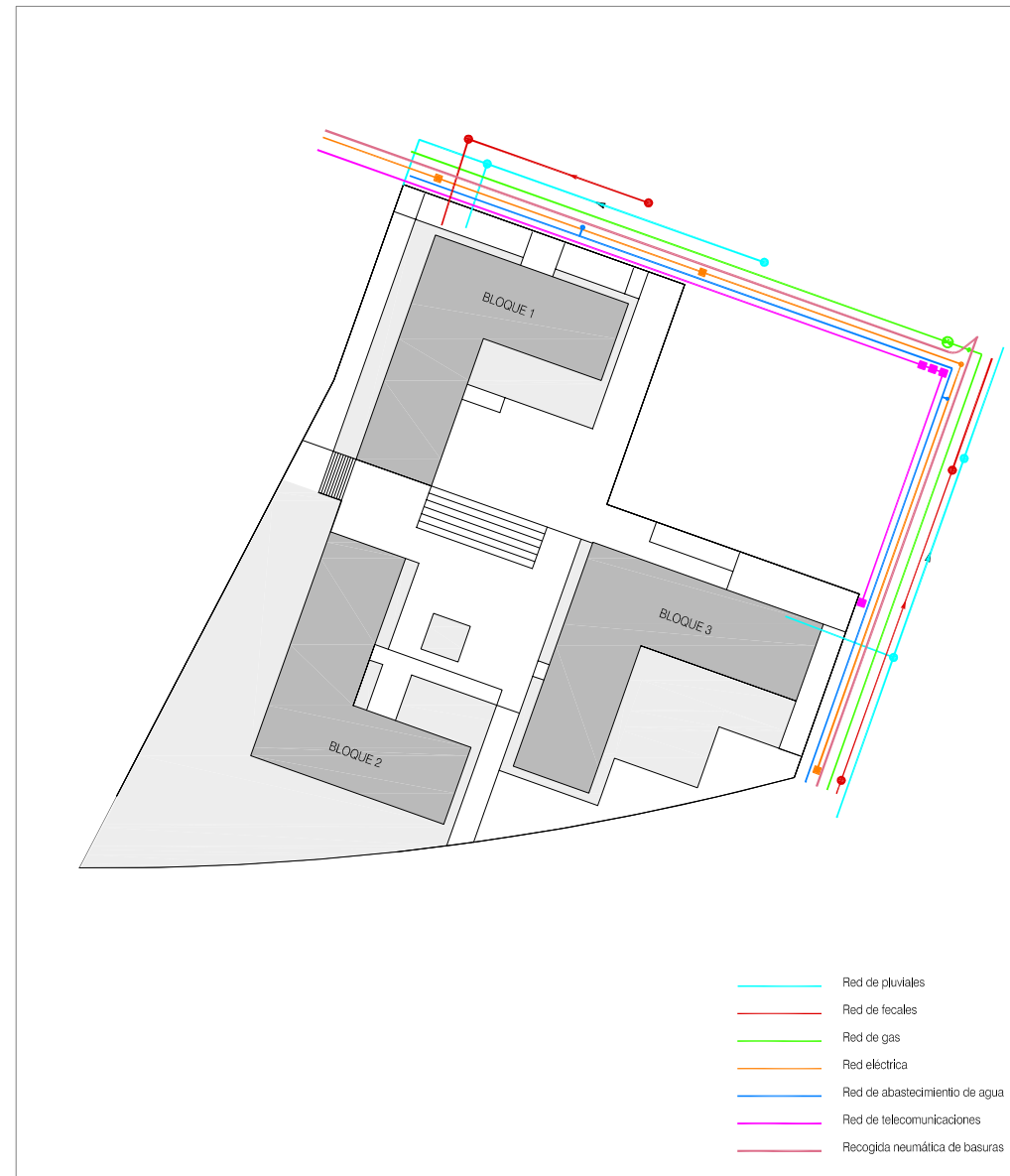
REDES GENERALES E 1/500