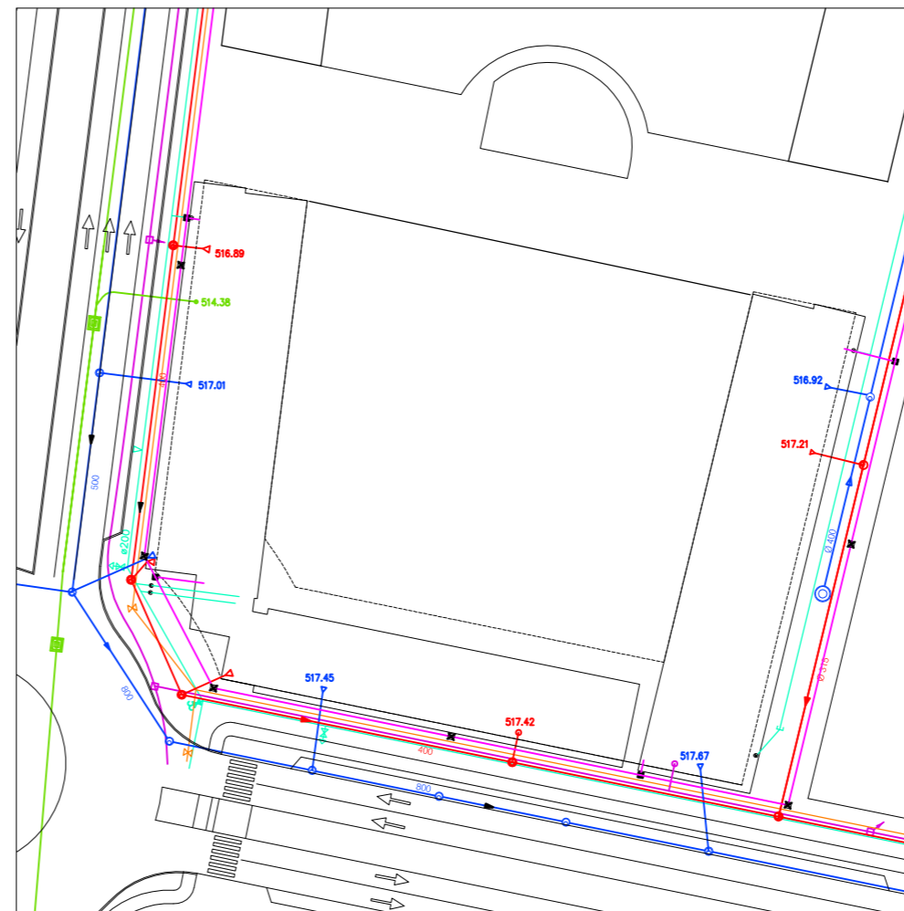
REDES GENERALES E 1/500