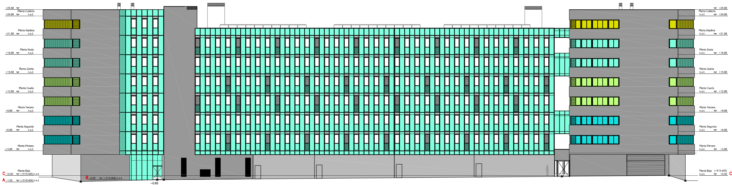
ALZADO B-C FACHADA SUR