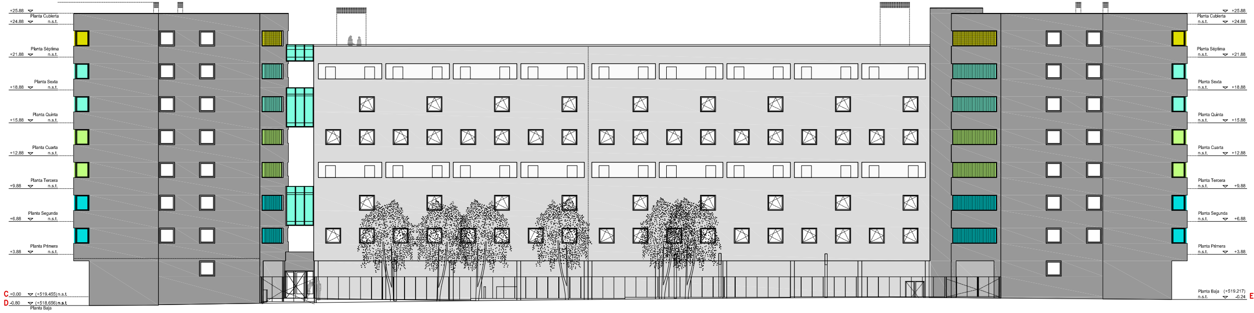
ALZADO D-E FACHADA NORTE