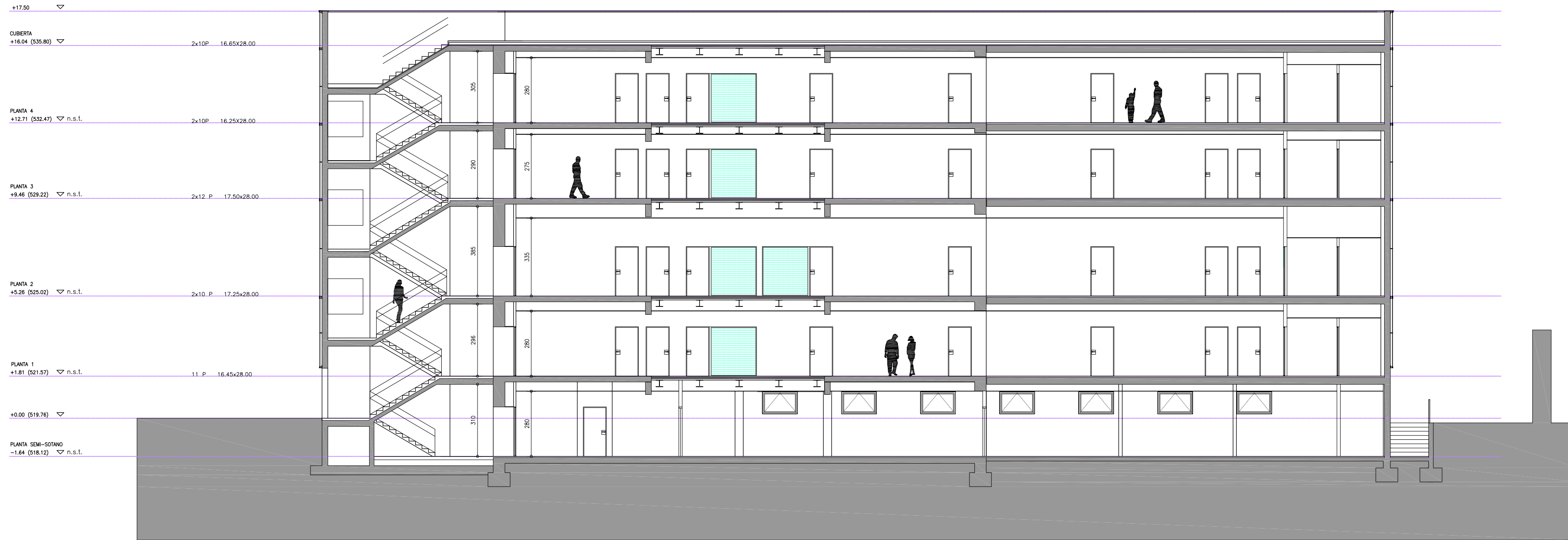
SECCION LONGITUDINAL S3